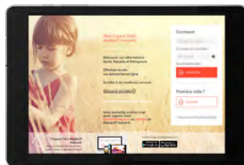
Espace client Malakoff Humanis